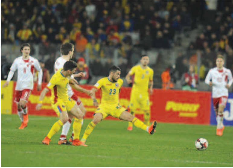
A román csapat igen szerény játékkal rukkolt elő, zsinórban negyedik mérkőzésén bizonyult képtelennek a gólszerzésre, és ezzel az eredménnyel jelentősen csökkentette esélyeit, hogy kijusson az oroszországi világbajnokságra.

Gól nélküli döntetlennel ért véget vasárnap késő este a Kolozsvár Arénában a Románia és Dánia közötti labdarúgó-mérkőzés a 2018-as világbajnokság E selejtezőcsoportjában.