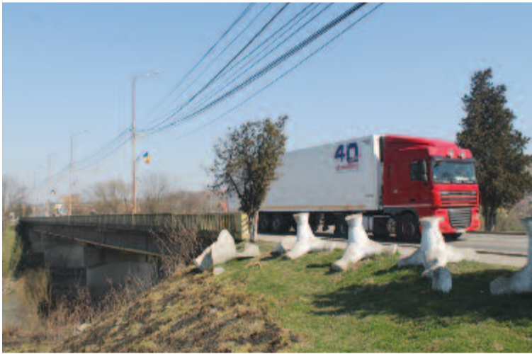
A javítás előtt álló Maros-híd

– A közelmúltban emlékeztünk meg a magyar kultúra napjáról, március 15-i ünnepséget szerveztünk. Legközelebb magyar majális tartunk, tavaly első alkalommal az Eczkentelepen, a Szócs család birtokán tartottuk. Ez a rendezvény nagyon fontos, hiszen a szövetségben szükség van arra, hogy különböző települések magyar fiataljai találkozzanak, ismerkedjenek. Tavaly radnóti, enyedi és aranyosgyéresi fiatalok jöttek el a majálisra. Részt veszünk a városnapok szervezésében, szeptemberben aztán a magyar napok következnek.