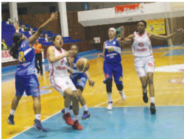
Akción a marosvásárhelyiek 2-es számmal játszó idegenlégiója: nemigen tudták megállítani a jászvásáriakat.

Ami tény, Sălceanu egészen más stílusban cserél, gyakrabban forgatja a játékosokat, a kilenc rotációban mindenkinek fontos szerep és idő jut, és ezzel egyes játékosok