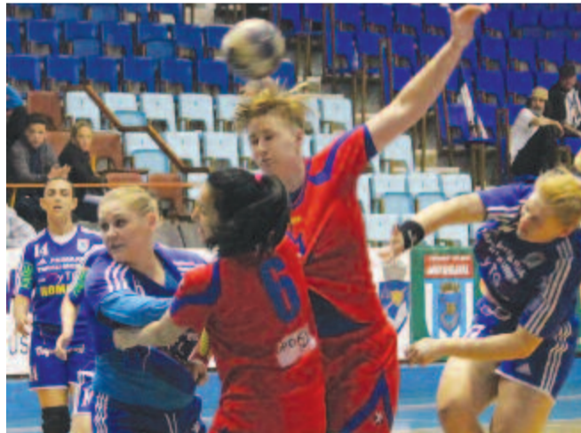
A marosvásárhelyiek rutinból oldották meg a legtöbb akciót.

A papírfornának megfelelően megnyerte a Brassói Kiválósági Központ fiatal játékosai eleni bajnokit a Marosvásárhelyi Mureșul női kézilabdacsapata az A osztályos bajnokság 19. fordulójában – hiszen ebben a sportágban is sokat számít a tapasztalat.